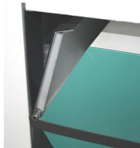
Bypassklappe beim Verschließen des Wärmetauschers

Plug and play Alle Anschlüsse sind steckerfertig vor-konfektioniert. Anschließbar sind Bis zu 4 verschiedene Bedienteile, Vorheizregister & der SCHRAG-Safety-Manager